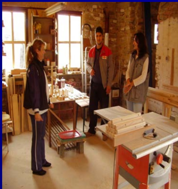
Керамика и дрво