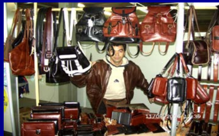
Производи од коже